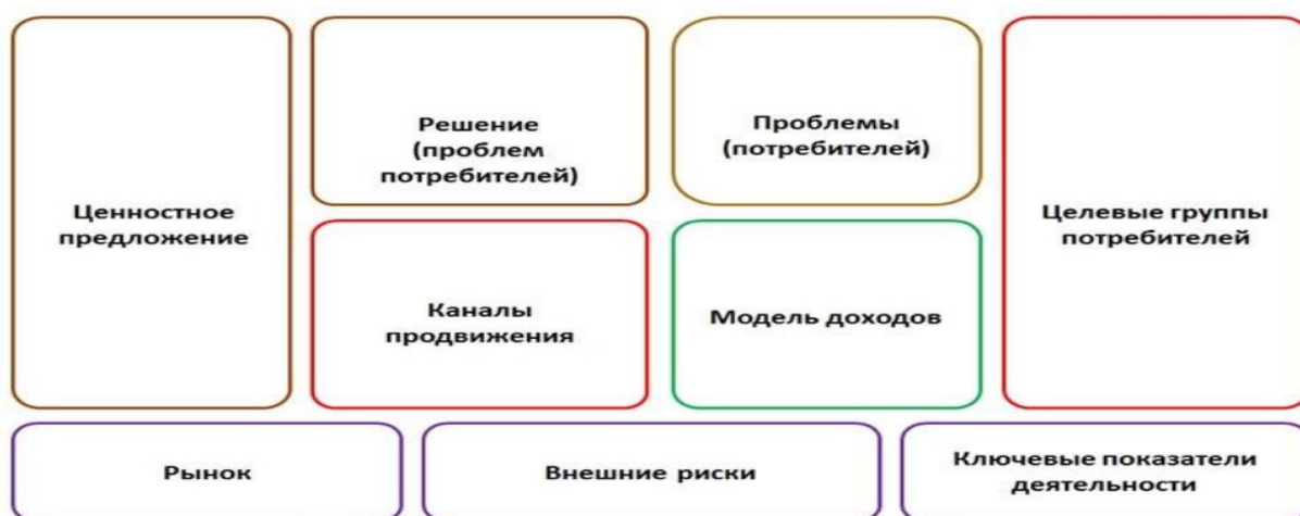
Рис. 1. Схема-алгоритм создания бизнес-плана и прогноза развития среды в инновационной экономике